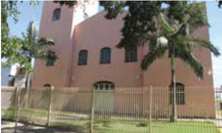
Igreja Matriz de Nossa Senhora de Lourdes