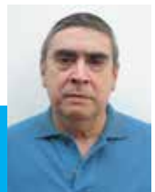
Acacio Vieira de Carvalho Escola Bíblica “São João Paulo II”

Como batizados precisamos nos esclarecer para “chegarmos à unidade da fé e do conhecimento do Filho de Deus... Para que não continuemos crianças ao sabor das ondas, agitados por qualquer sopro de doutrina, ao capricho da malignidade dos homens e de seus artificios enganadores” (Ef 4,13-14).