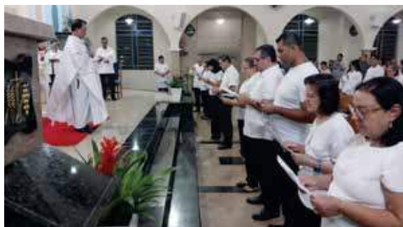
Missas de Envio - Matriz Nossa Senhora de Lourdes - 05/11/23