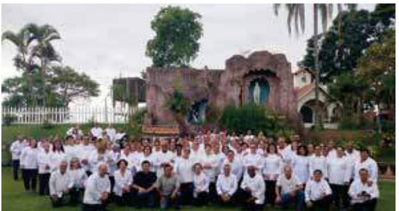
Forania Frei Galvão - Seminário Frei Galvão - 19/11/23

- 15/11 , na Capela do Hospital Frei Galvão: Missa em Ação de Graças pelos Ministros que atuam nos hospitais;