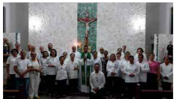
Missa - Capela do Hospital Frei Galvão - 15/11/23