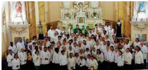
Forania Santo Antonio - Casa do Puríssimo Coração de Maria - 29/10/23