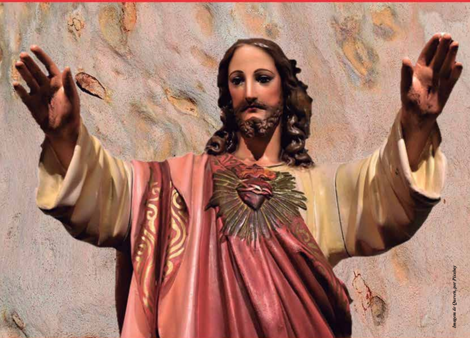
Imagem de Quevedo, por Pixabay