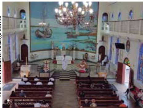
Missa - Paróquia São Pedro