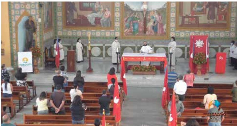
Missa - Santuário Frei Galvão