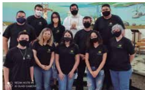
Pascom - Paróquia São Pedro