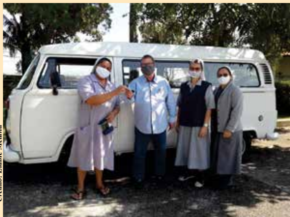
Crédito: Elaine Medina