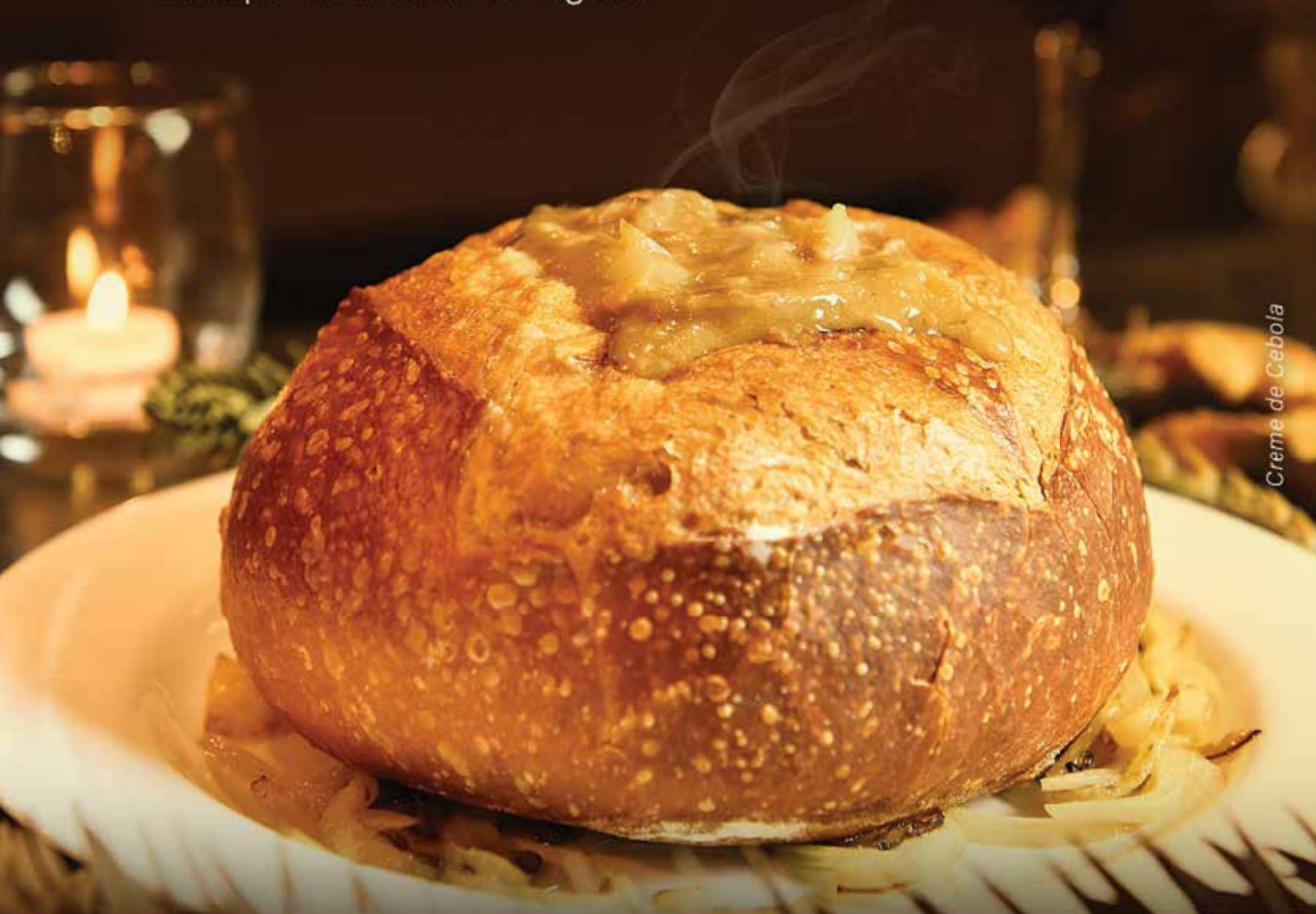
Creme de Cebola

Venha pra Tutti e saboreie o melhor cardápio de inverno da região.