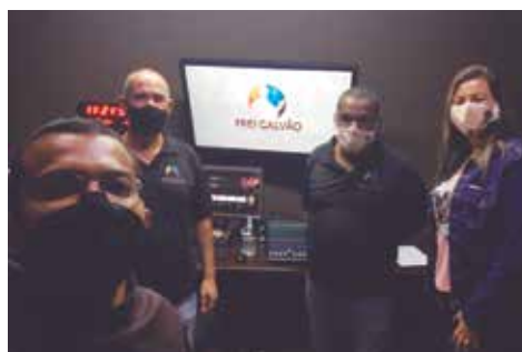
Pascom - Santuário Frei Galvão

O Dia Mundial das Comunicações Sociais foi estabelecido pelo Concílio Vaticano II através do decreto “Inter Mirifica” em 1963 e acontece no domingo antes do Pentecostes.